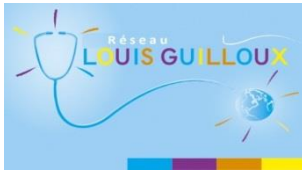
Schéma de partenariats santé mentale